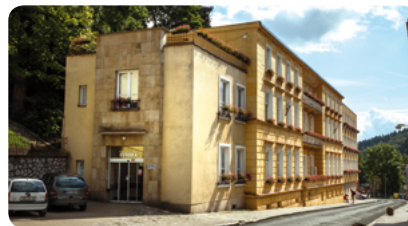
Evropa Dependance 50m od centra, výtah, WiFi.