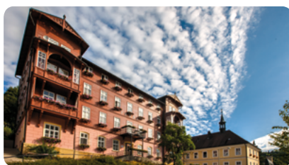
Hotel Terra Hotel v centru, hlavní budova, výtah, WiFi.