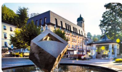
Janský Dvůr Hlavní budova, výtah, WiFi.