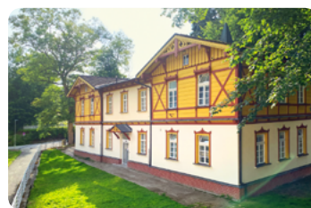
Čechie Dependance v centru, bez výtahu, WiFi.